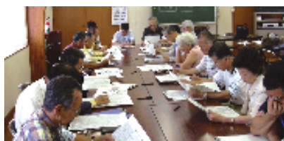
勉強会・ワークショップ

エリア 金沢区 寺前東町・寺前西町・金沢町 面積 約66.8ha 世帯数 約3,260世帯 用途地域 第1種低層住居専用地域、 第1種住居地域、準住居地域、 近隣商業地域、商業地域