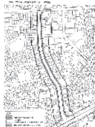
神奈川大口通地区地区計画図

あまり厳しいルールにしてしまうと、場所によっては建替えもできなくなります。そうなれば、いずれお店を畳むしかありません。今ここで商売をしている人が、商売を続けられないような規制では意味が無い。これが大口通商店街の選択です。