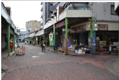
大口通商店街の街並み