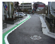
整備された細街路