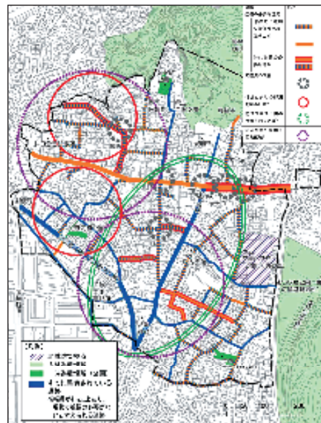
寺前東町・寺前西町・金沢町まちづくり協議会防災まちづくり計画図

防災のまちづくりを進める上で、3.11の震災は非常に大きな衝撃と危機意識を与えました。海際の避難場所を高台の公園に変更したり、津波を考慮した避難訓練を実施するといった、特に津波への対策を中心に、防災対策の抜本的な見直しを現在進めています。