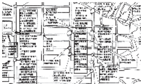
交通事故の発生マップ

漠然と「事故が多い」というのではなく、具体的な数字でこのまちの道路の危険性が判明したのです。市から派遣されたコーディネーターの助言もあり、交通事故の防止を最優先に取り組むことになりました。