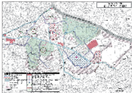
三春の丘まちづくり協議会防災まちづくり計画図

こうして地域住民が協力した結果、コーディネーターの意見を取り入れ道路の幅を広げたり、見通しを良くしたりといった防災のまちづくりを進めるための7つのプロジェクトと、優先的に取り組む地区を定めた『三春の丘まちづくり協議会防災まちづくり計画』がまとまり、平成22年に地域まちづくりプランとして認定されました。