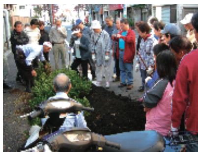
地域住民の手による植栽整備