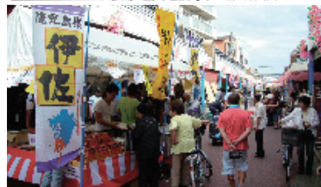
60周年鹿児島物産展