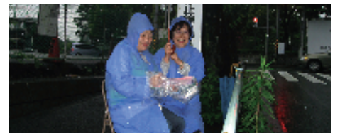
交通量調査当日の様子